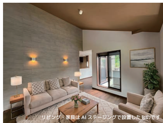
リビング・家具はAIステージングで設置したものです