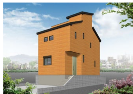
C号棟イメージパース