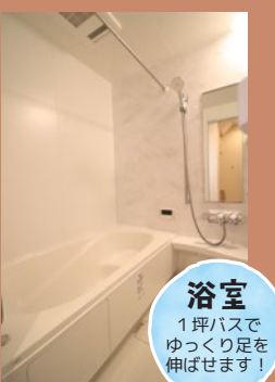
浴室 1坪バスで ゆっくり足を 伸ばせます!