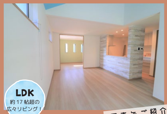
LDK 約17帖超の 広々リビング!

駅近で可愛いナチュラルな家 駅から徒歩7分に、隠れ家的なナチュラルハウス発見! 可愛さ×暮らしやすさをぜひ体験してみてください!