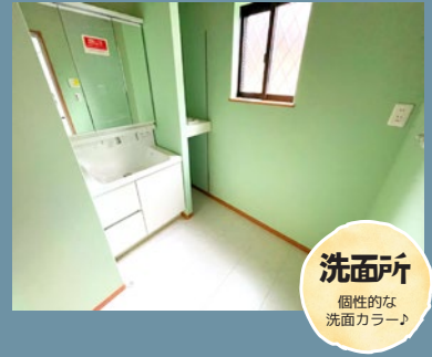
洗面所 個性的な洗面カラー♪