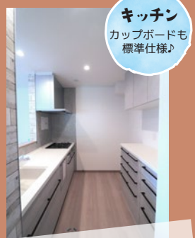
キッチン カップボードも 標準仕様♪