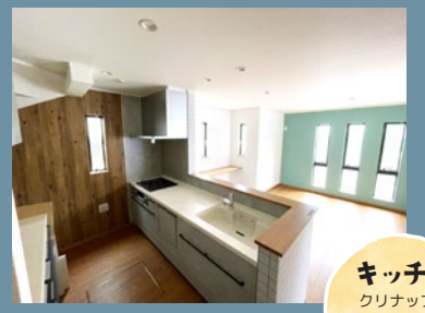
キッチン クリナップ スタジオ 食洗器付き♪