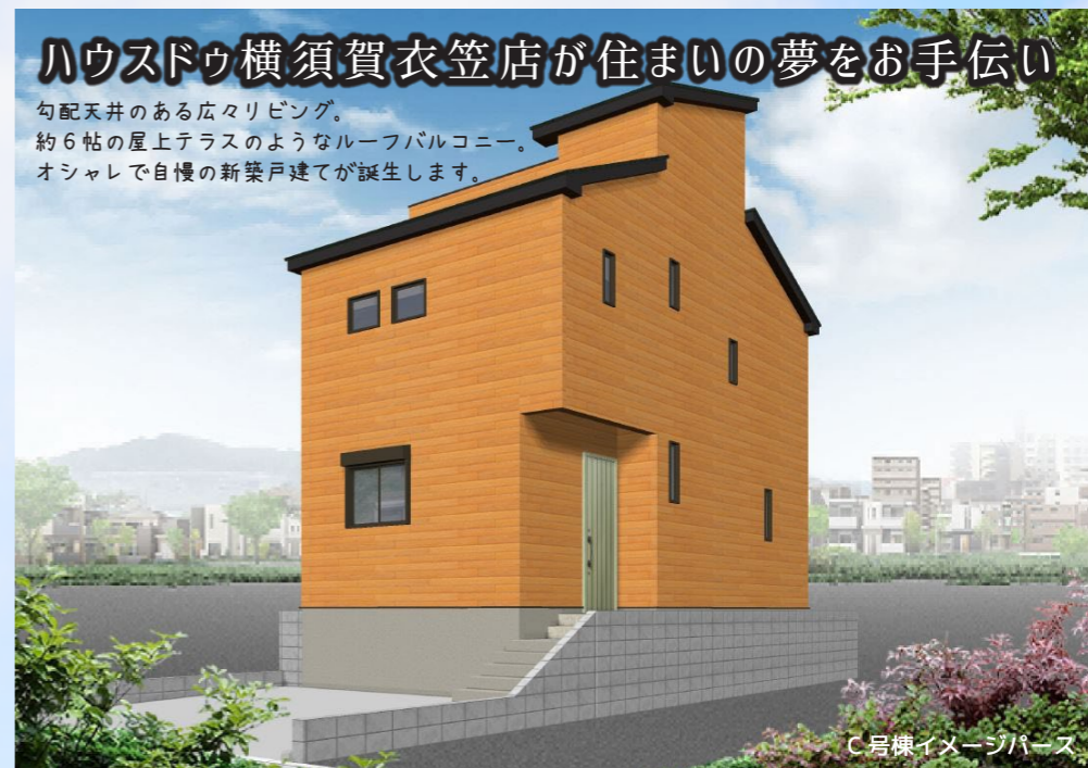
C号棟イメージパース

勾配天井のある広々リビング。約6帖の屋上テラスのようなルーフバルコニー。オシャレで自慢の新築戸建てが誕生します。